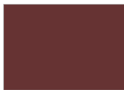
12. チョコレート・ブラウン (BR-6)