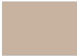
7. シャンピニオン (ltg6)