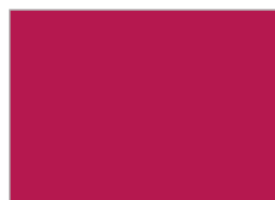
18. ハイビスカス・レッド (v1)