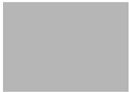
1. プラチナ (Gy-7.5)