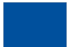
20. パープル・ネイビー (v19)