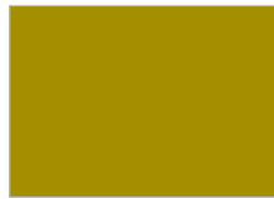
8. マスタード (dp8)