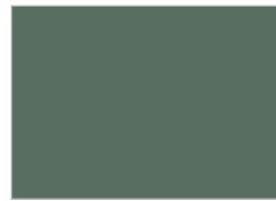
9. オリーブ・グリーン (g12)