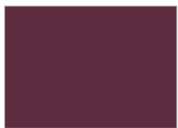
11. ガーネット (dk24)