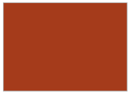
6. ゴールデン・オーカー (dp4)