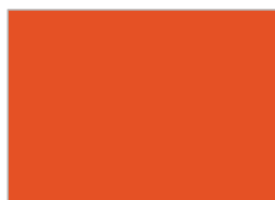
17. ブリリアント・オレンジ (v4)