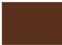
9. マットブラウン (#5B301D)