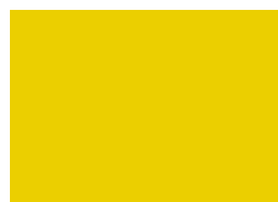
15. マスタード (#EBCF00)